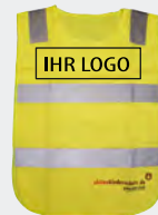
neongelb mit leuchtstreifen